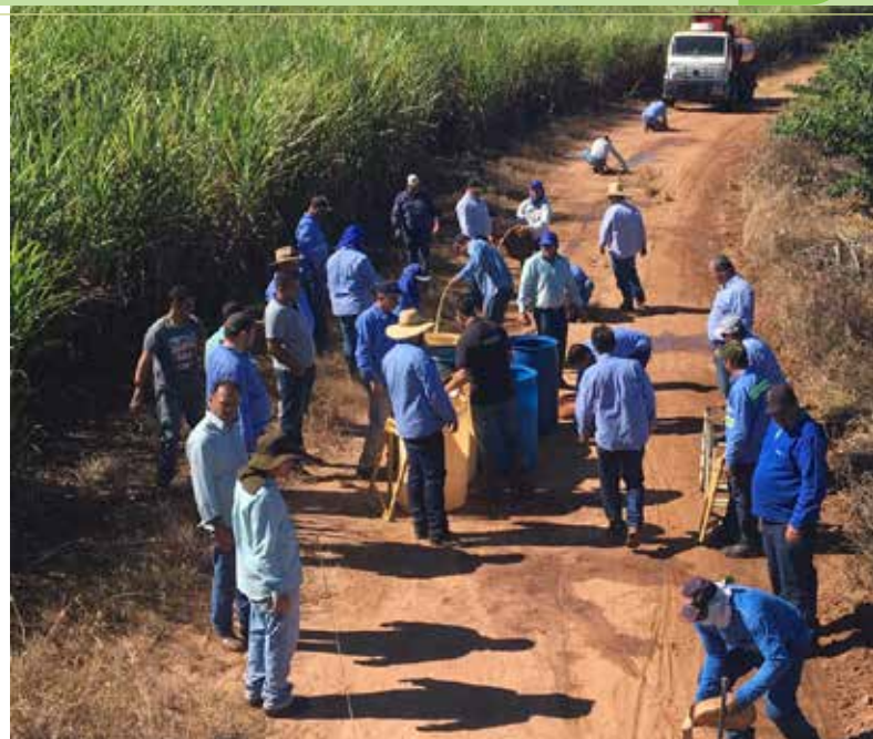
Treinamento capacitou as brigadas de incêndio de 15 empresas canaveiras associadas a Ascana