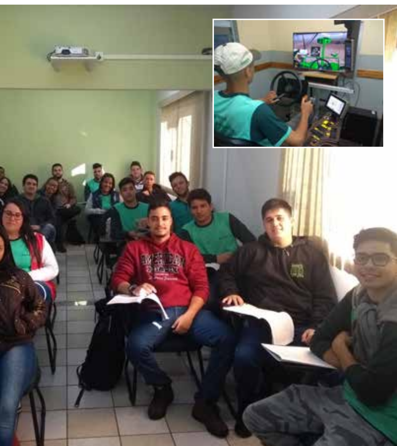
Os jovens saem preparados para o mercado de trabalho; no detalhe, aluno em