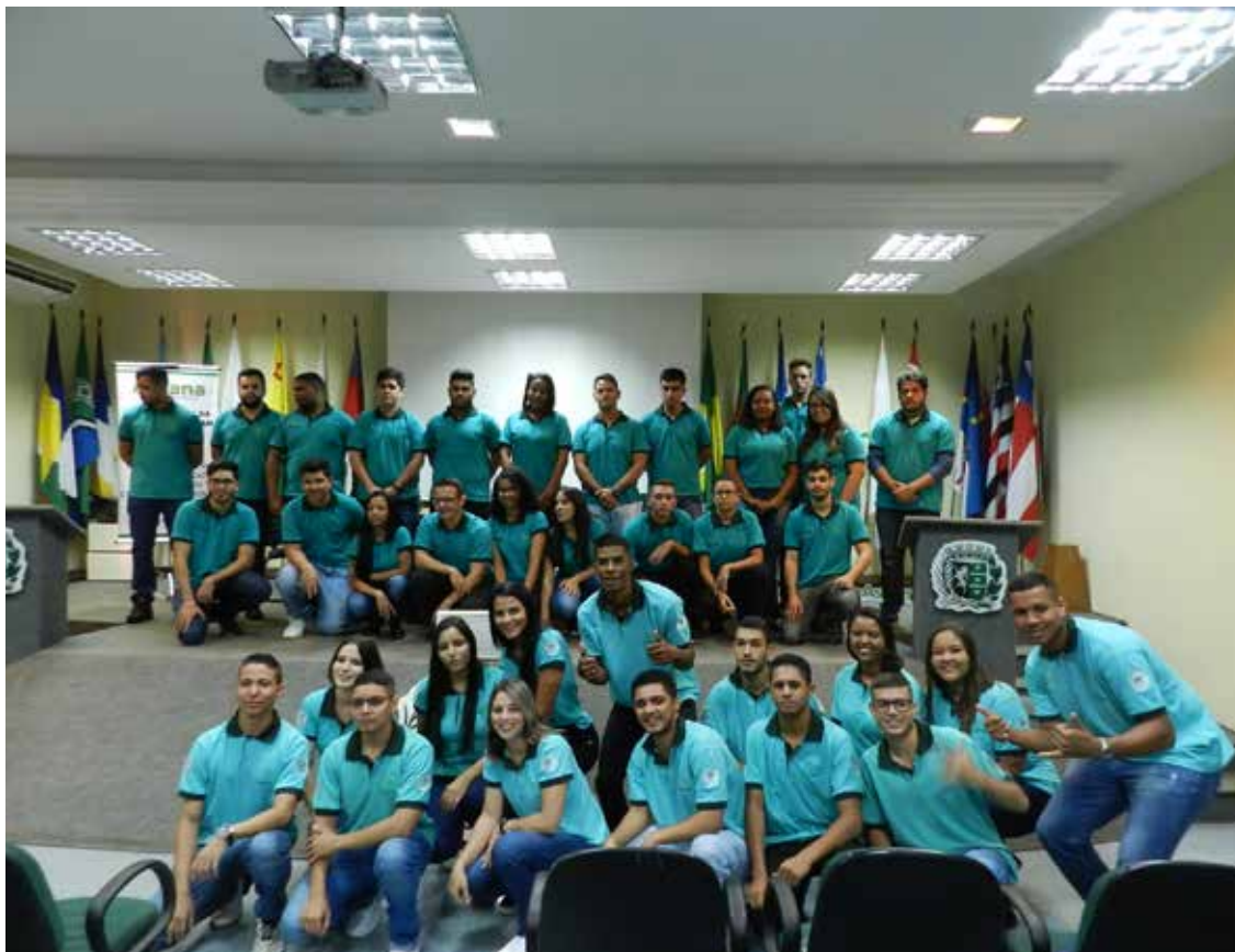
Formandos de Macatuba e os novos aprendizes de Lençóis Paulista