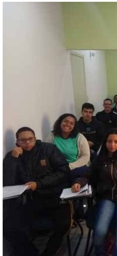
Com aulas práticas e teóricas os jovens simulam colheita de cana